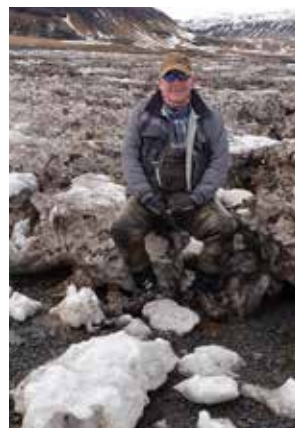
Setið á ísborgum