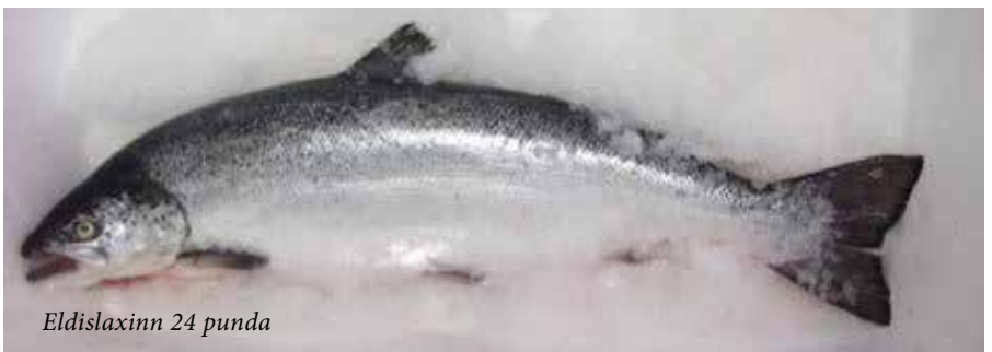
Eldislaxinn 24 punda

Mér tókst að tala hann inn á þátttöku í þessu uppátæki, sem það var orðið núna þar sem þetta var ekki lengur bara hugmynd heldur var búið að ákveða þetta, og fór ég nánar yfir áætlanina með honum sitjandi á rúmstokknum hjá honum. Eftir dágóða stund þá gaf ég honum leyfi til