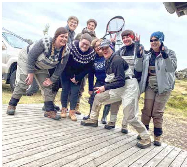
Veidihópurinn Votar Varir setja sig í stellingar